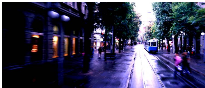
„Zürich“ von Young Artist Yves Maurer

Ob für die Wohnung, das Büro oder die Wand-Deko in Restaurants, Lounges und Bars – Lumobox bietet für jedes Interieur das besondere Bild. Mit dem „Wohnzimmer-Vorschau-Modus“ auf der Website, im exakten Grössenverhältnis zur besseren Visualisierung, werden die Werke optimal präsentiert. Bei Bestellung erfolgt die direkte Lieferung nach Hause.